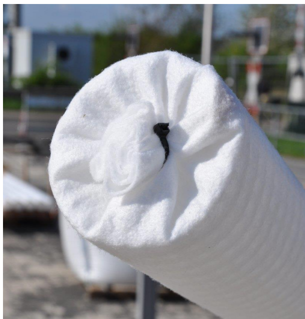
Fig.: Element de inceput

Odata montate corpurile rigolelor, se va aseza teava perforata la partea inferioara a acestuia, centrat, incepand cu elementul de capat. Pentru aceasta cotul va fi fixat in orificiul prevazut pe peretele lateral al corpului rigolei. Atentie sa nu obstruct