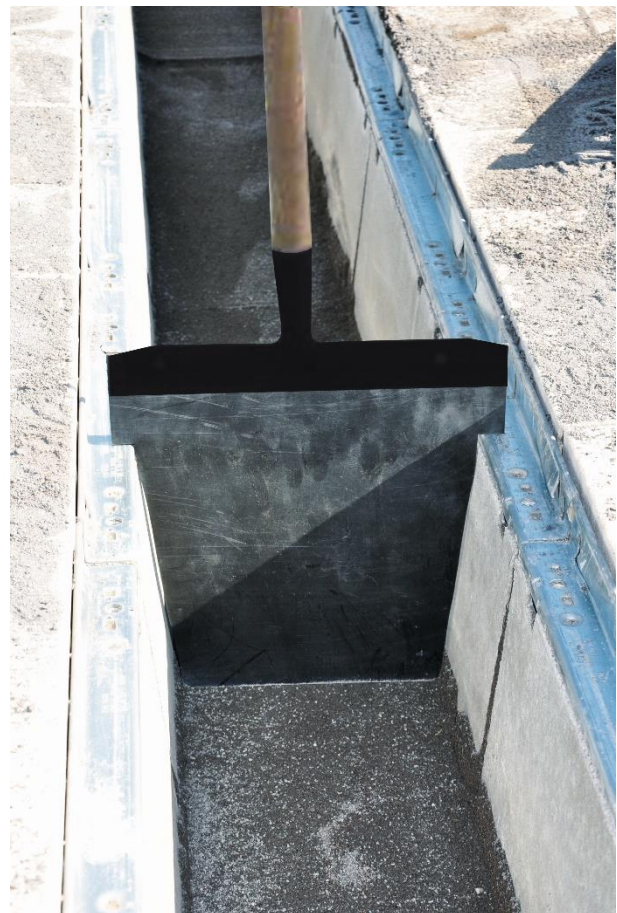
Abb.: Zugscharr zum Abziehen des Substrates (hier mit DRAINFIX CLEAN FSU)

Das Substrat ist unverdichtet in die Rinne mit Drägerrohr einzufüllen und mit einer Schablone oder Zugscharr abziehen.