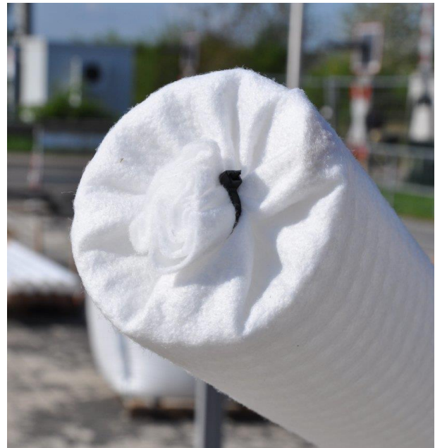
Abb.: Anfangselement, gebunden

Nach dem Einbau der Rinnenkörper werden die Filtergitterrohre mittig und frei auf der Rinnensohle verlegt, beginnend mit dem Endelement. Hierzu ist der Rohrbogen in die Doppelmuffe, welche in die Rinnenwandung integriert ist, einzuschieben. Dabei ist darauf zu achten, dass der Ablauf nicht durch zu tief eingeschobene Filtergitterrohre behindert wird. Es folgt der Einbau der Mittelelemente und zuletzt des Anfangselementes. Bei Bedarf sind die Filtergitterrohre auf die benötigte Länge abzulängen.