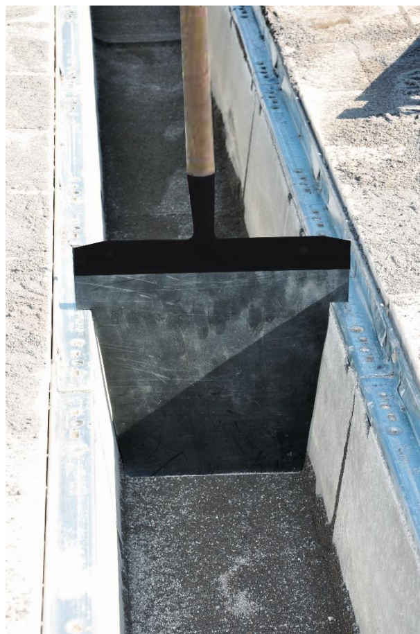
Fig.: Scula de nivelat/curatat strat filtrant (aici cu DRAINFIX CLEAN FSU)

Corpurile de rigola cu teava perforata asezata in interior se vor umple cu stratul filtrant fara ca acesta sa fie compactat, doar prin nivelare sau greblarea