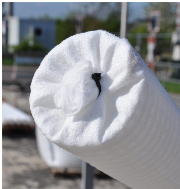
Fig.: Element de inceput

Odata montate corpurile rigolelor, se va aseza teava perforata la partea inferioara a acestuia, centrat, incepand cu elementul de capat. Pentru aceasta cotul va fi fixat in orificiul prevazut pe peretele lateral al corpului rigolei. Atentie sa nu obstructionam descarcarea cu teava perforata. Apoi urmeaza elementele intermediare si, la final, elementul de inceput. Daca este necesara, se poate taia teava perforata la lungimea dorita